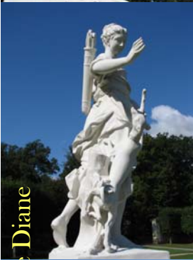
Compagne(s) de Diane

< Les statues positionnées dans la place des corps de garde d'en haut, près du Musée sont : le berger, Venus callipyge, les compagnes de Diane.