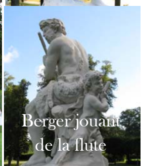
Berger jouant de la flûte