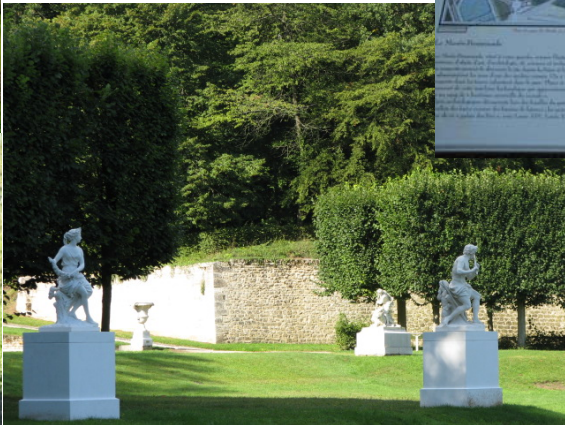
Flore, le berger flûteur et Hamadryade, ont retrouvé leur place d'origine